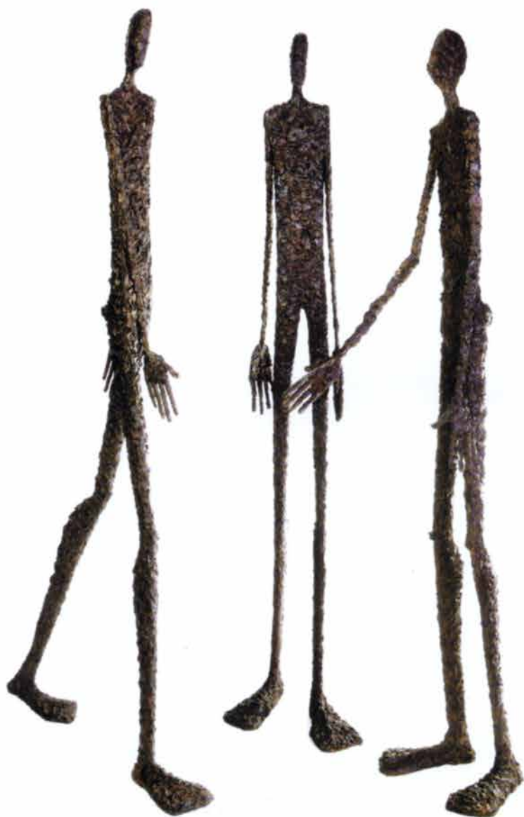
Val 「ÉTONNEMENT」 (Astonishment) 驚奇

由於瓦兒所表現的是你我心中的底蘊，因此，欣賞瓦兒不必朝聖，因為，藝術是和生活一樣簡單的事，她的作品彷彿有著一股電流，讓人在接觸之際，自然而然，喚醒內心深處的悸動震撼。