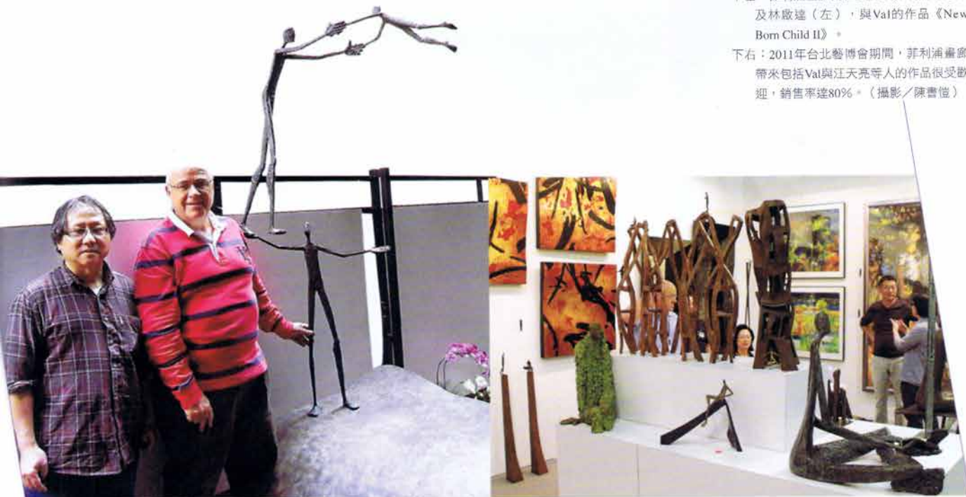
下右：2011年台北藝博會期間，菲利浦畫廊帶來包括Val與江天亮等人的作品很受歡迎，銷售率達80%。