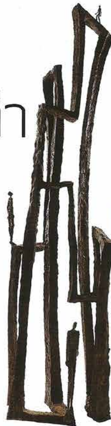
"Attrait de La Liberte"