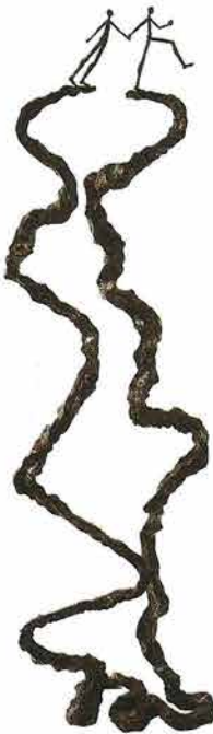
"Mignonne, allons voir"