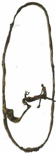
"Portrait de Famille"