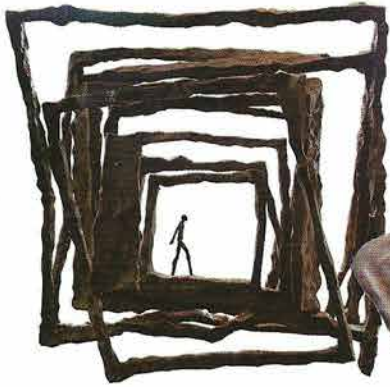
"Invitation au Theatre"

ปัจจุบันวาเลรี กูตาร์ด เดินทางไป ๆ มา ๆ ระหว่าง กรุงเทพฯ กับ ปารีส และยังคงเดินทางไปสถานที่ต่างๆ เพื่อแสดงผลงานและท่องเที่ยว ประสบการณ์เหล่านี้ ช่วยเปิดมุมมองและสะท้อนความรู้สึกของเธอ ที่มีต่อสิ่งรอบตัว ผสมผสานจนกลายเป็นส่วนหนึ่ง ในผลงานได้อย่างกลมกลืน